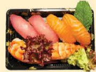
s41. Vis Nigiri Mini 6st. € 12,00