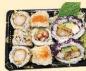
s42. Warm Box 9st. € 15,00