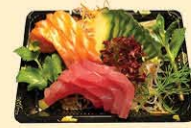
s46. Mix Sashimi 8st. € 11,50