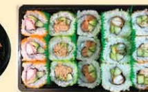
s61. Sushi Box A 15st. € 19,00