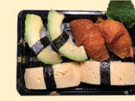
s40. Veg Nigiri Box 6st. € 10,00