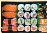
s62. Sushi Box B 20st. € 19,00