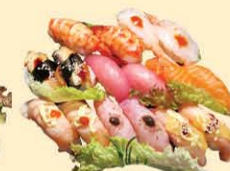
s43. Vis Nigiri Box 16st. € 31,50