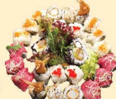
s44. Family Box 27st. € 41,50