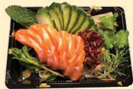
s45. Zalm Sashimi 6st. € 10,00