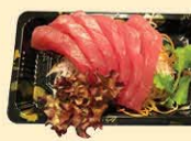
s47. Tuna Sashimi 6st. € 11,00