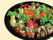
s60. Luxe Box 26st. + sashimi € 42,50