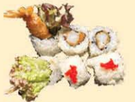
s36. Ebi Flying 6st. € 11,00